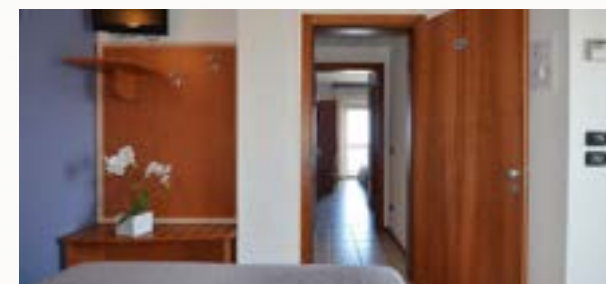
Zwei Zimmern mit Verbindungstür 17 qm. Mit Balkon, Badezimmer, Minibar, Klimaanlage und Föhn.

***für Zimmer Family room werden die Ermässigung für Kinder bei der Buchung festgelegt.