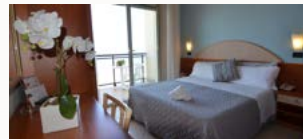
Zimmer ca. 19 qm. Mit Balkon mit Meeressicht, Minibar, Klimaanlage und Föhn.

ZUSCHLAG FÜR PENTHAUS ZIMMER € 5,00 AM TAG PRO PERSON